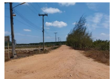
เส้นทางขนส่งแร่ในพื้นที่โครงการ