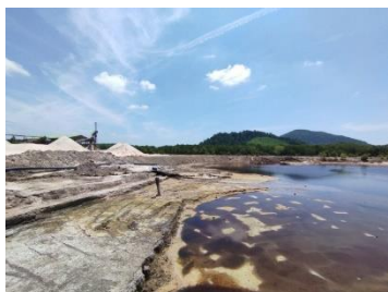
พื้นที่หน้าเมือง