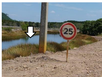
บ่อดักตะกอน