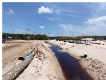
คูระบายน้ำ