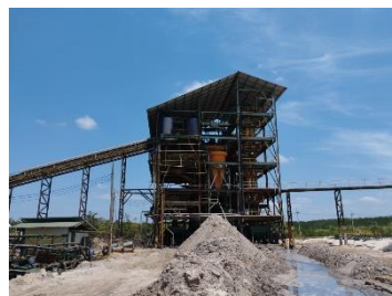
โรงแต่งแร่