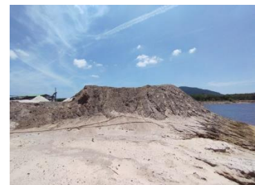
พื้นที่เก็บมูลดินทราย