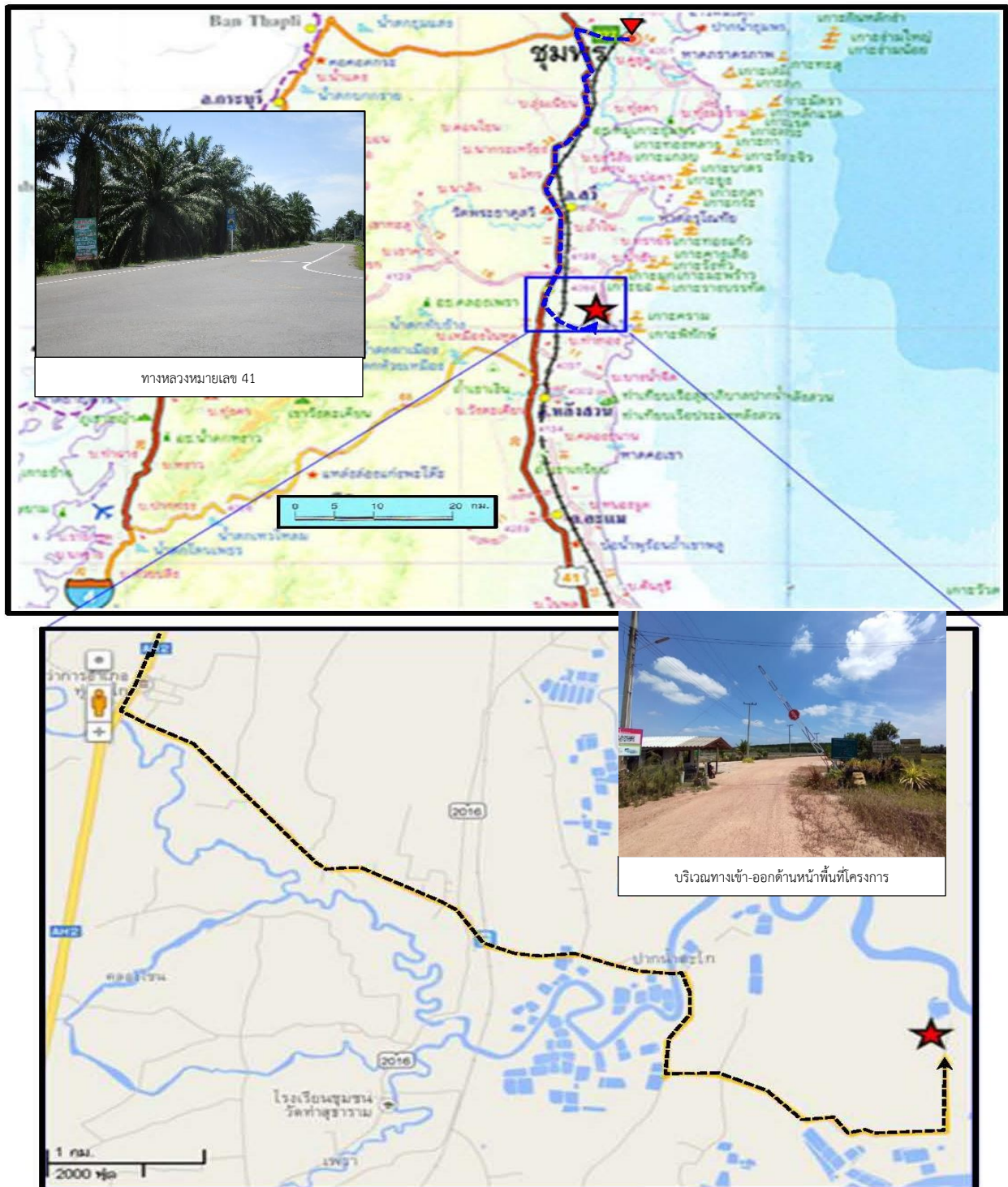
รูปที่ 1-3 แสดงการคมนาคมเข้าสู่พื้นที่โครงการ